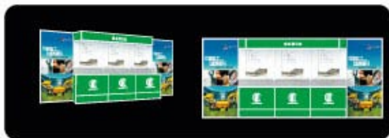
观众登记台展板广告