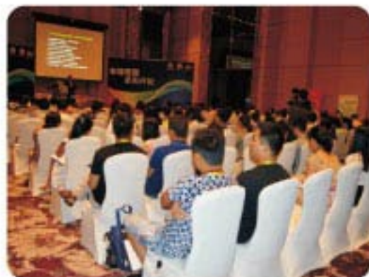
博览会同期举行的行业活动现场

注：主办机构负责安排场地、桌椅、投影设备、灯具及音响设备，协助主讲企业组织听众（请自备手提电脑）。