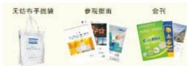
无纺布袋、采购推荐指南及会刊